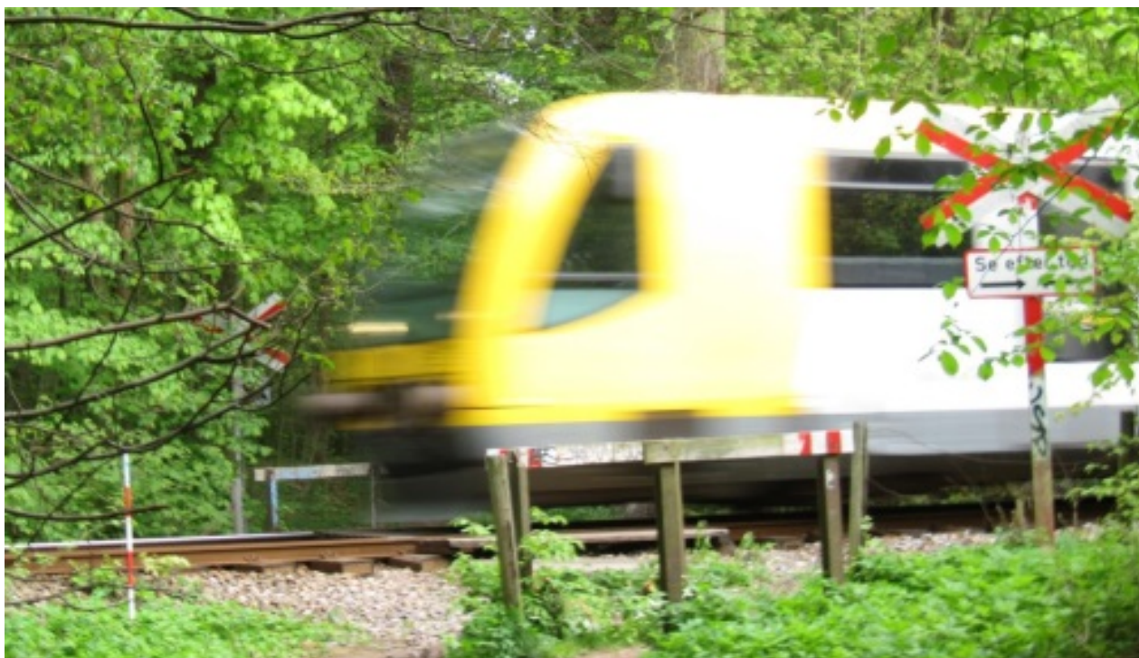
RegioSprinter ved overgang 15 mellem Ørholm og Brede.

Tirsdag den 29. april kl. 15:18 blev en person påkørt af Lokalbanens tog 191514 i overgang 15 på strækningen Nærum- Jægersborg. Personen døde kort efter hændelsen.