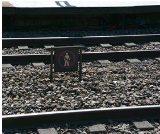
Foto 1 Skilting af overgang forbudt - mellem sporene

På det foreliggende grundlag er det ikke muligt at give en nærmere forklaring på, hvor den pågældende befandt sig i sporet.