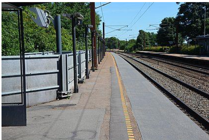
Foto 2 Nedgangen (ved køreledningsmasten) "maskeret" af støjskærm. Set fra det område hvor personen befandt sig, inden han sprang ned i sporet.