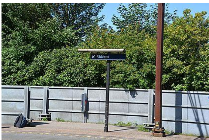
Foto 3 Nedgangen set fra perronen ved spor 1

Efter gennemførelse af indledende undersøgelser og evaluering af de tilgængelige data, er Havarikommissionen nået til den konklusion at yderligere undersøgelser ikke vil lede til rekommandationer af forebyggende karakter, eller vil afdække forhold af væsentlig betydning for jernbanesikkerheden. Med henvisning til lov om jernbane § 83, har Havarikommissionen fravalgt at foretage yderligere undersøgelser af sagen.