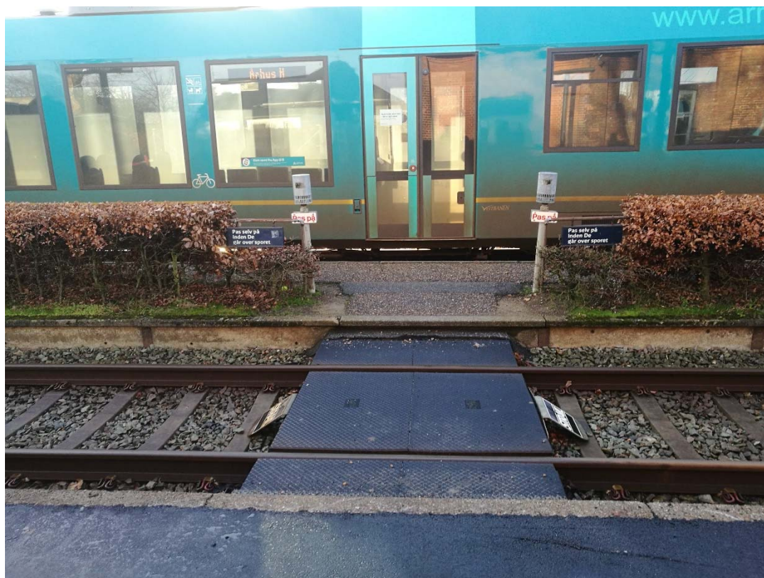
1 Perronovergangen set over spor 1 med tog i spor 2.

Når tog nærmer sig overgangen, skal varslingsanlæggets højttalere udsende advarslen: ”Gå ikke over sporet, der kommer tog”. Varslingsanlægget skal fungere, for at der kan sættes signal til ”kør” eller ”kør igennem” til spor 1.