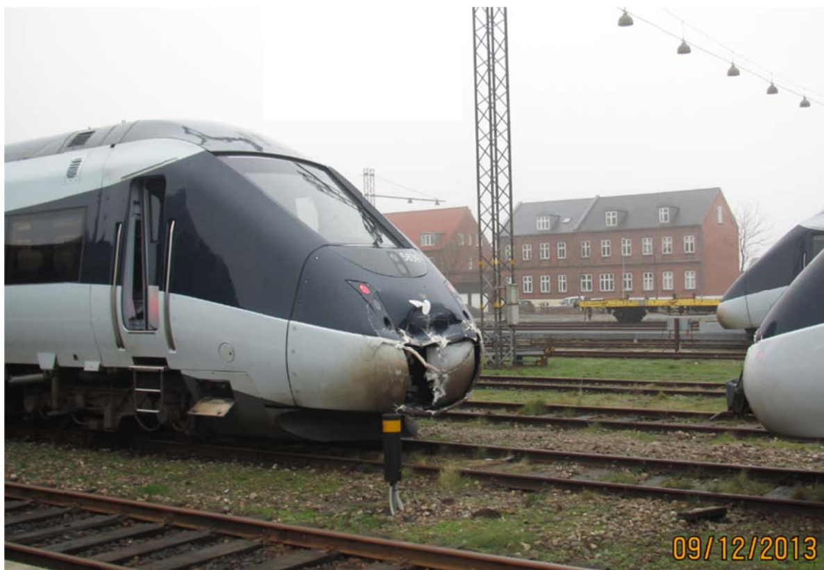
Esbjerg spor 4