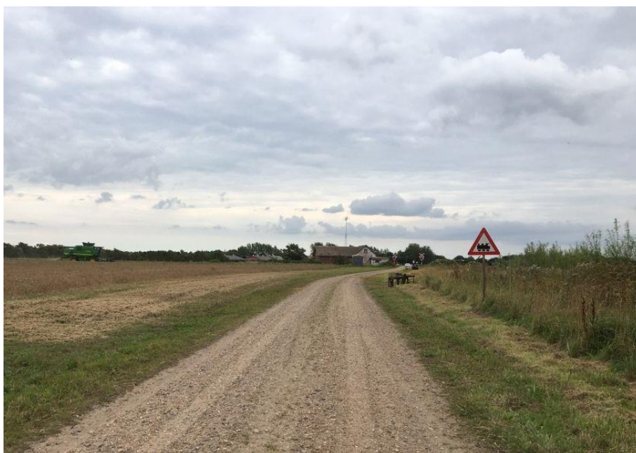
Foto 1. Bilistens oversigt fra nord mod overkørsel 264

Toget bestod af Lint-togsæt 1010 fra Arriva, der efter kollisionen standsede med bagenden ca. 150 meter fra overkørslen. Der var 15-20 passagerer med toget – ingen ombord på toget kom til skade.