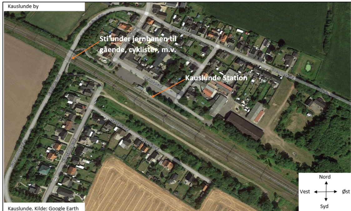
Figur 1. Kauslunde Station og adgangsvej via sti under jernbanebroen

Kauslunde deles af jernbanen, hvor størstedelen af byen ligger på nordsiden af sporet, hvor der også er parkeringspladser og adgang til perronerne. Adgang for bl.a. gående og cyklister der befinder sig syd for jernbanen, skal ske gennem en gangsti, der går parallelt med Kauslundevej under jernbanen.