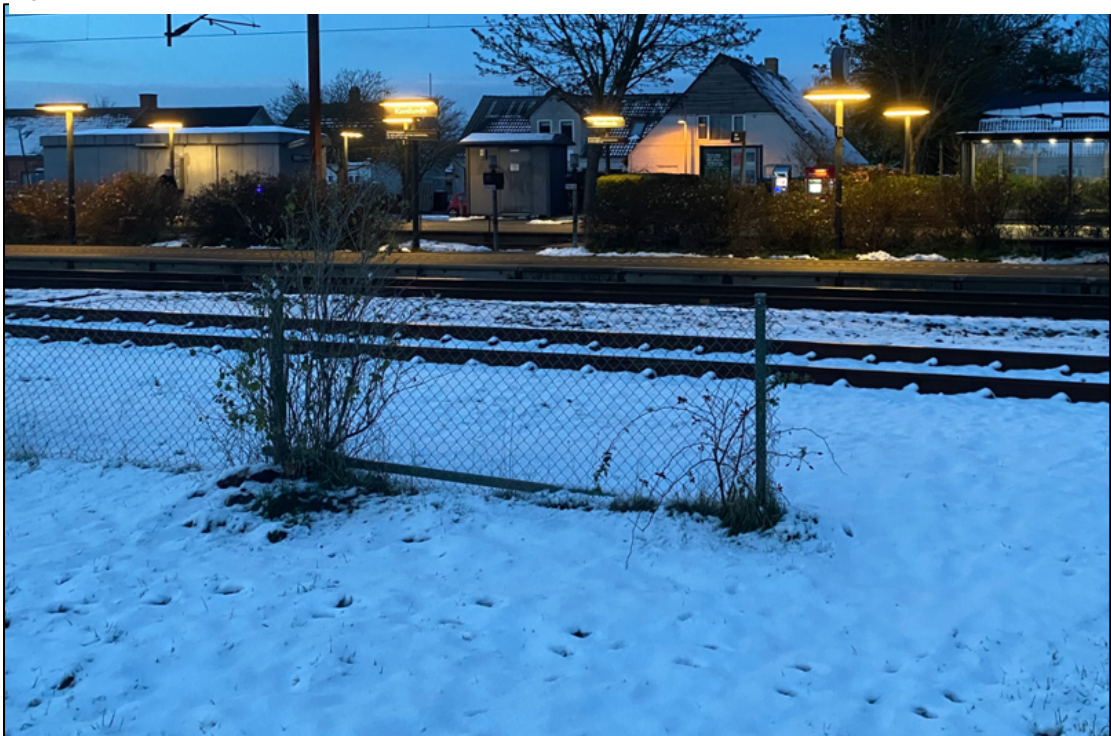
Foto 1. Kauslunde Station, foto af hegn og perron / perronovergang.